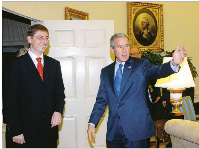
A magyar-amerikai barátság útján